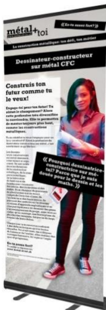
Dessinateur-constructeur métallique CFC