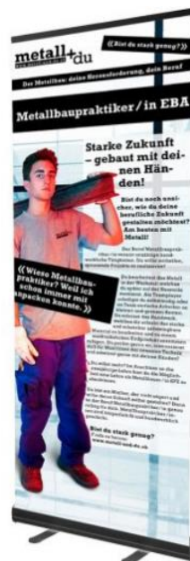
Aide-constructeur métallique AFP