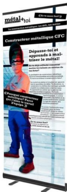
Constructeur métallique CFC

En prêt : roll-up „métal+toi“ petit, 85x215 cm / 10pro