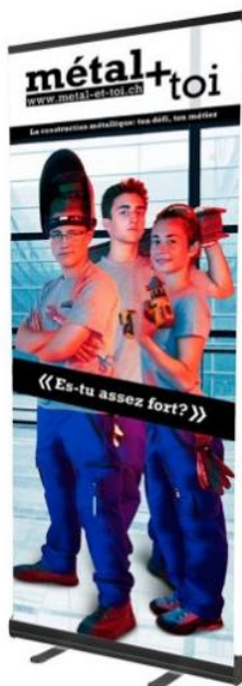
team constructeur métallique CFC